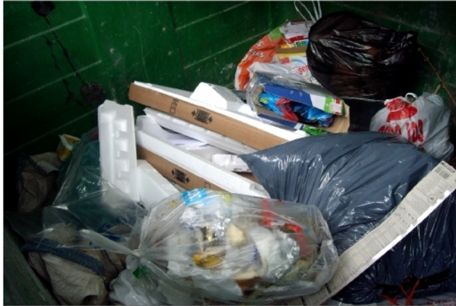
Orgánico, plástico y papel en el mismo contenedor

El otro día escuchaba un spot radial del ayuntamiento de Alpedrete, instando a los ciudadanos a colaborar en las campañas de reciclaje metiendo los recipientes de plástico en el contenedor amarillo, papel en el azul y cristal en el apropiado. Precisamente en estos últimos días he podido escuchar varios comentarios sobre la falta de atención que presta esta corporación a este asunto: que si todos los contenedores de papel están a rebosar, que si hay pocos de vidrio y mal situados o la lenta reposición de todos ellos cuando se estropean y quedan inservibles para los camiones de recogida. Pues bien, aunque en mi zona de residencia esta situación es el día a día desde hace años, me puse a recorrer las calles del resto del pueblo y pude constatar que casi todos los contenedores de papel estaban llenos siendo imposible introducir más residuos, lo mismo pasa con los de plásticos, rebosando de bolsas, la gente que se preocupa por recoger los envases en sus casas y meterlos en bolsas a parte se ven obligados a dejarlos en los contenedores de orgánicos, los de vidrio están muy